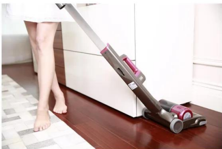
чистя с прахосмукачка