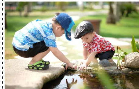
играя с приятели