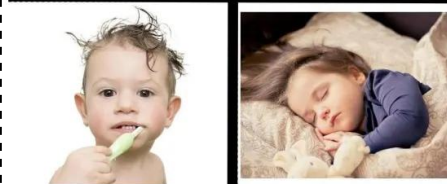
Често срещани глаголи