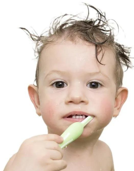
мия си зъбите