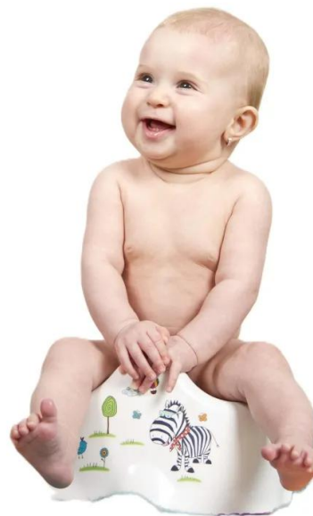
седя на цукало