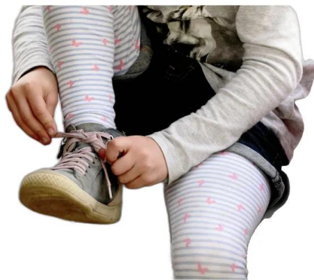
вързвам връзки на обувки