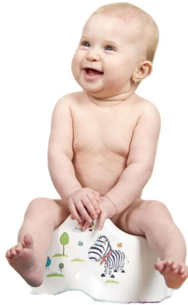
sitzen auf dem töpfchen