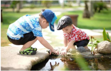
mit Freunden spielen