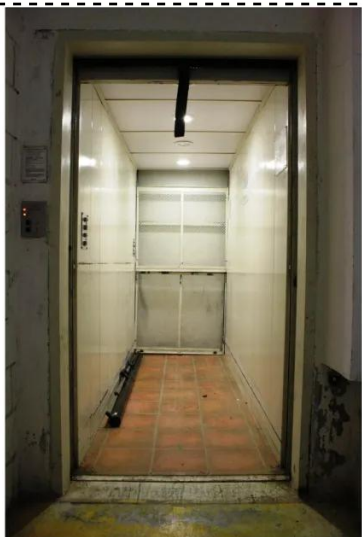
ανελκυστήρας αλυσίδα πόρτας