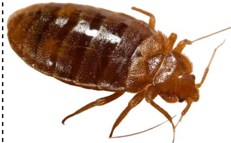
punaise de lit