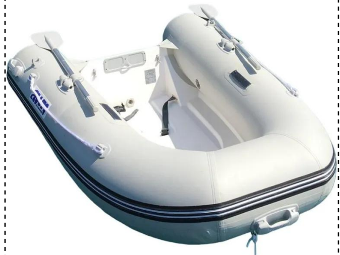
čamac na napuhavanje