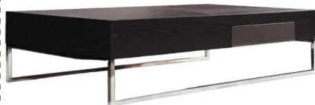
nappali asztal / kávézó asztal