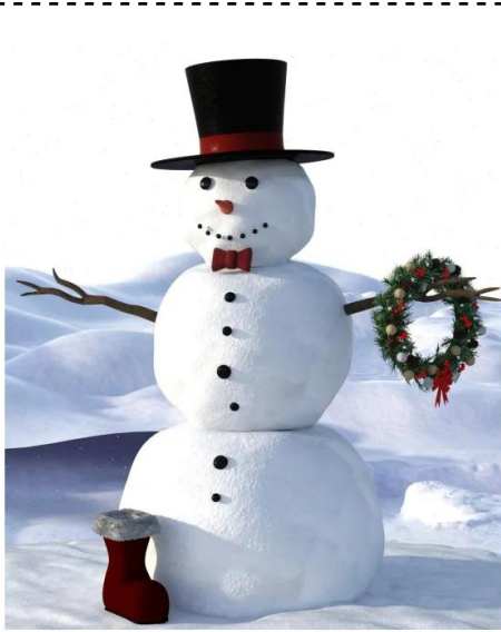
pupazzo di neve