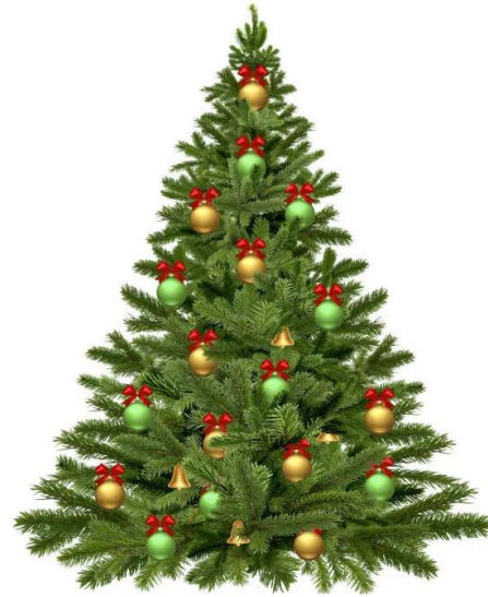
albero di natale