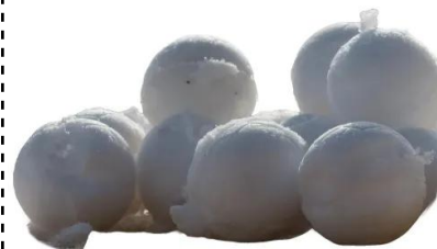
palla di neve