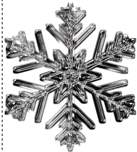
fiocco di neve