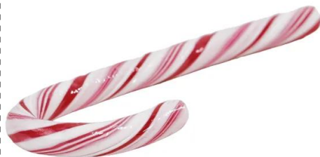
bastoncino di zucchero