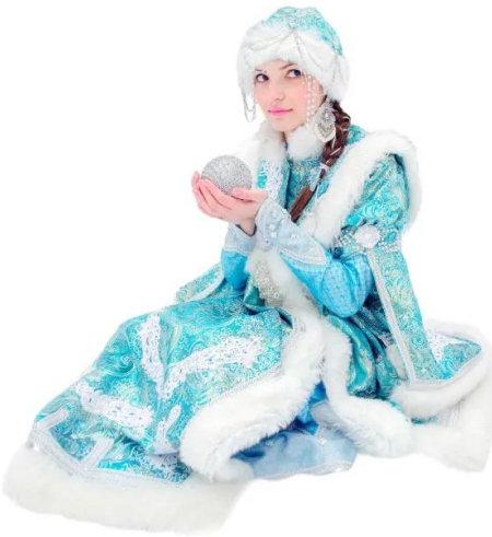
vergine delle nevi