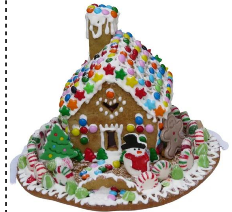
casetta di marzapane