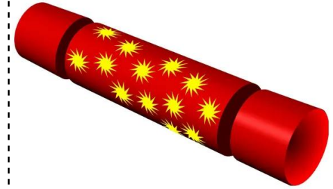
cracker di natale