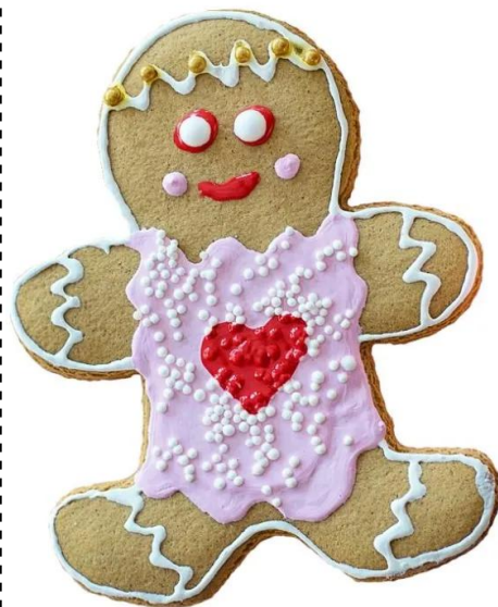
omino di pan di zenzero