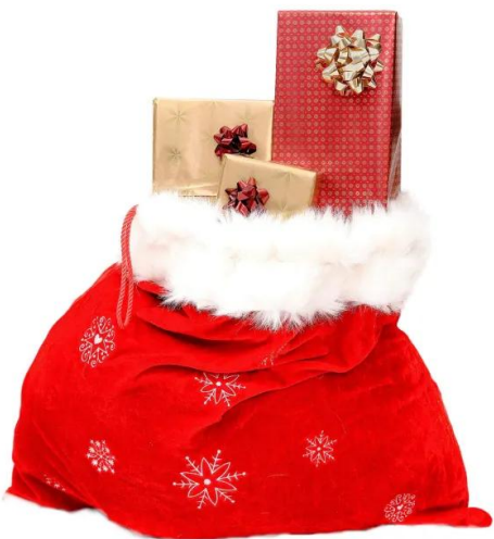
sacco di babbo natale