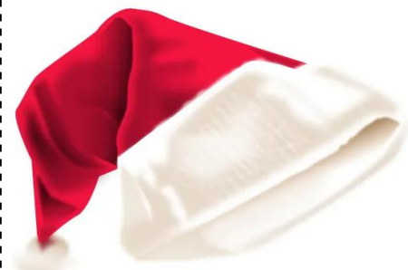
cappello di babbo natale