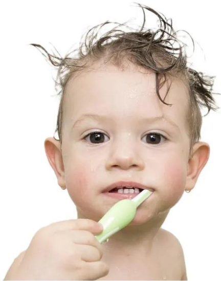
escovar os dentes