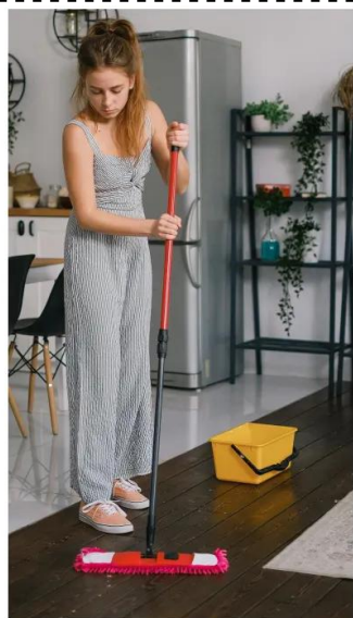
limpar o chao