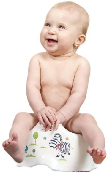
sentar no penico