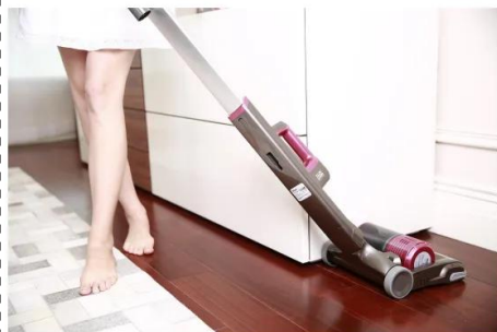
passar aspirador de po