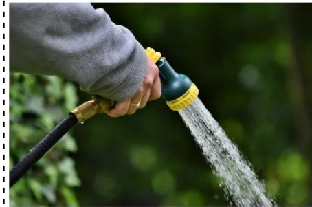
molhar as plantas