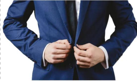
abotoar a camisa