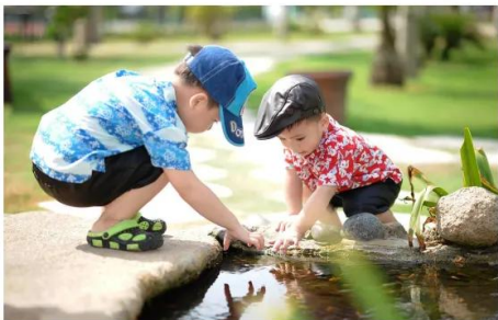
brincar com os amigos