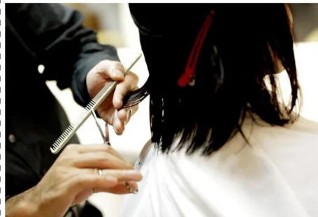
cortar o cabelo