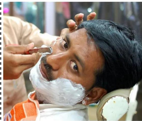
fazer a barba