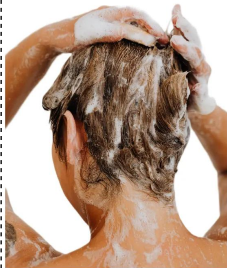
lavar o cabelo