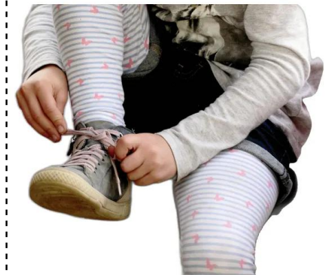
amarrar os sapatos