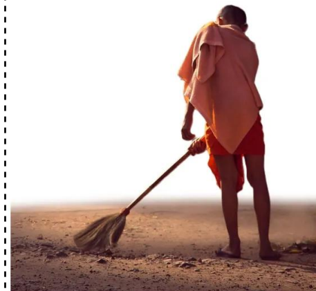
varrer o chao