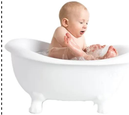
banho de banheira