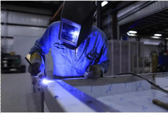
hàn gōng 焊工